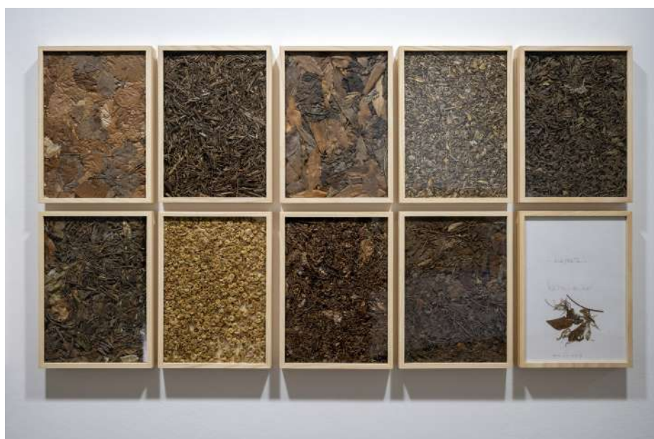
substrata (détail), 2016 végétation (substrats) pressée, récoltée principalement autour de la lagune de venise, en grèce, suisse, inde, allemagne et haute provence 31 x 22,3 x 3,8 cm © Jean-Baptiste Warluzel