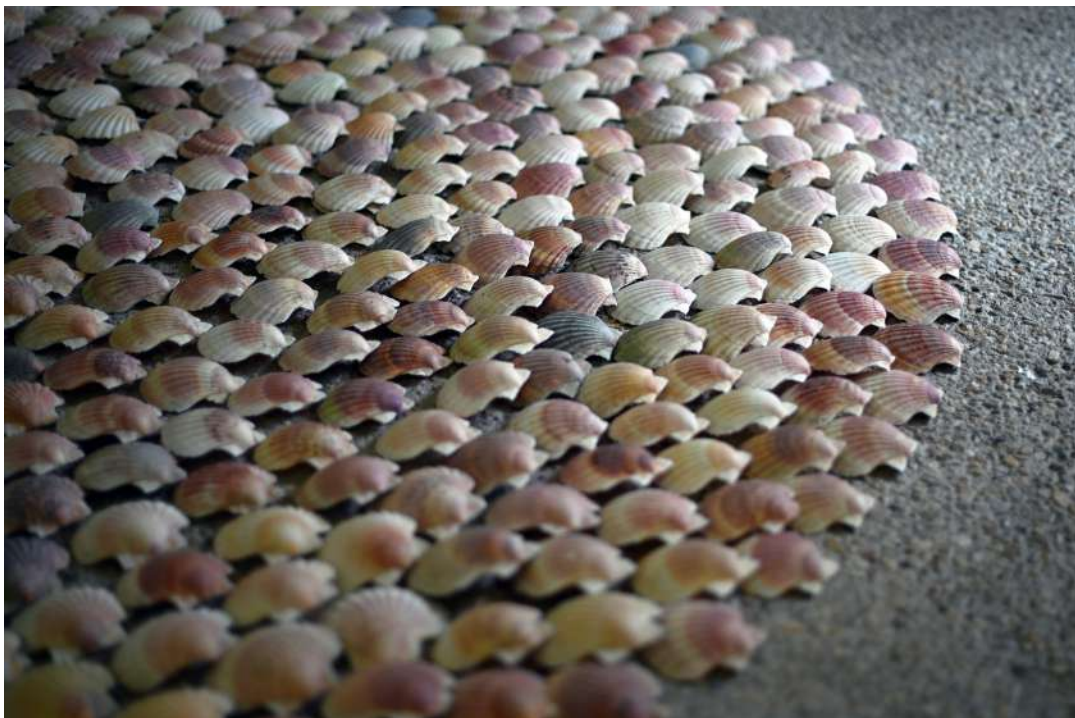
emprunt à la côte, 2025 coquilles saint-jacques Ø300 cm © Jean-Baptiste Warluzel