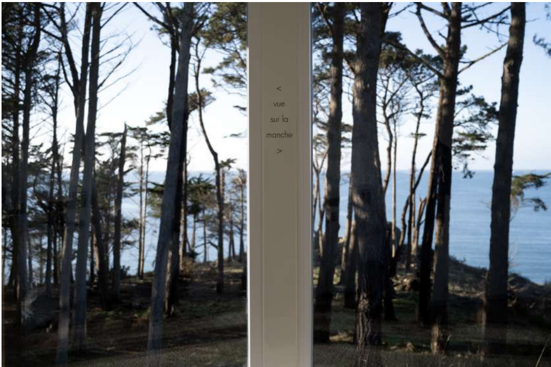
vue sur la manche, 2025