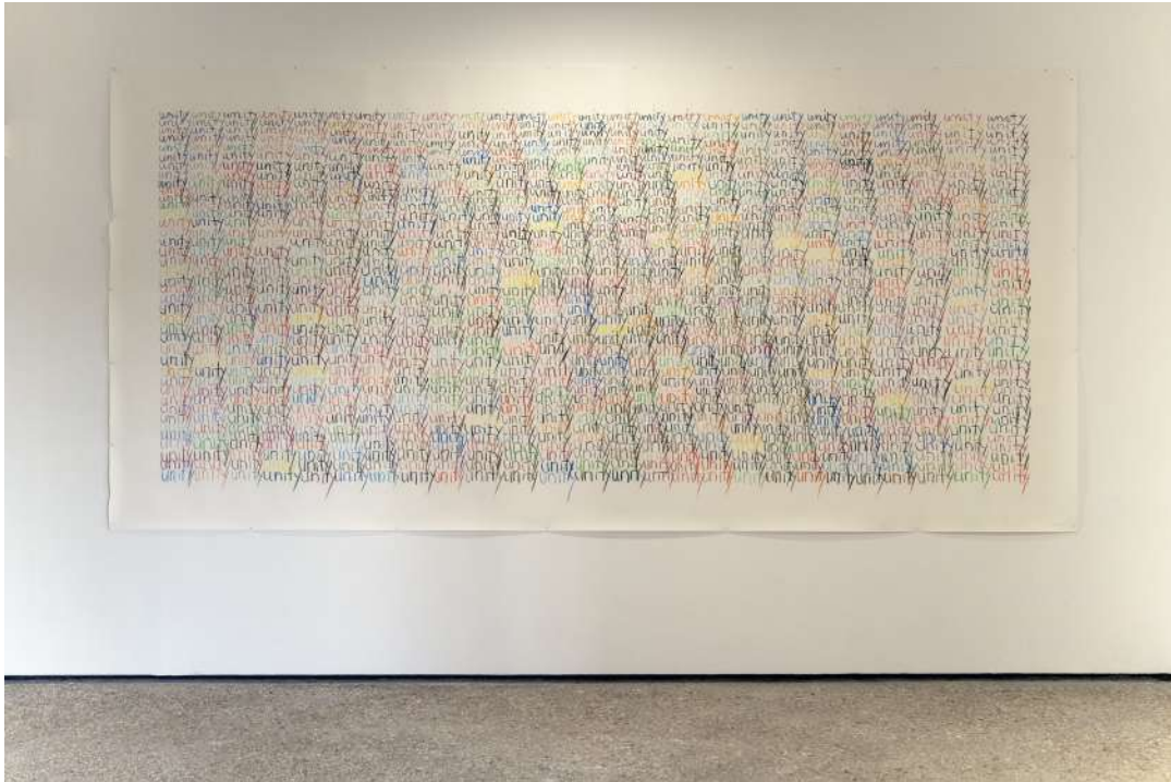
unity, 2008 crayons de couleur sur papier 200 x 430 cm © Jean-Baptiste Warluzel