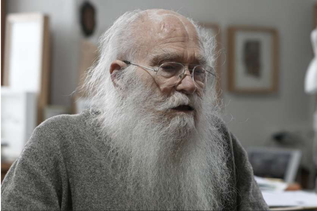
infinity, in finity, 2025 performance de herman de vries réalisation de Jean-Baptiste Warluzel vidéo 4K, couleur, son stéréo, 6'49 © Jean-Baptiste Warluzel