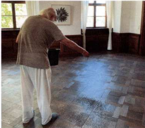
1. vom mittelpunkt aus das ausstreuen beginnen.