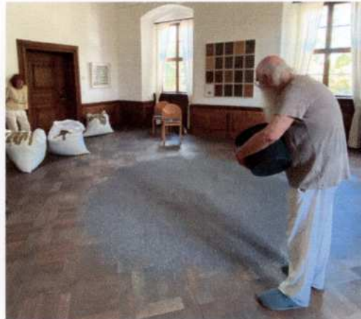
2. bis zum rand und gewünschter form fortsetzen.